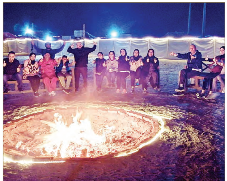
Origin team during the annual camp

The practice of organizing such event every year is to break the rhythm of day-to-day work and to consolidate the good relationship between all colleagues, as well as to achieve a “Work – Life Balance” and managing work stress by spending an entertaining and joyful free time with the whole family.