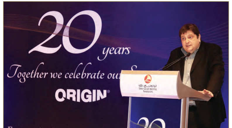
كلمة من الرئيس الأسبق للمعهد الدولي لإدارة المبيعات ISM - بريطانيا