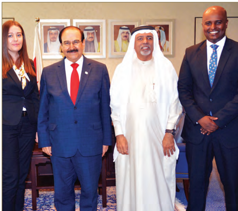
IFTDO Administration meet the Minister of Water and Electricity

Numerous of distinguished international speakers in the field of HR and HRD who contribute in inspiring others and raising the level of excellence in the qualifications of HR, with a focus on best practices and successful transformation stories.