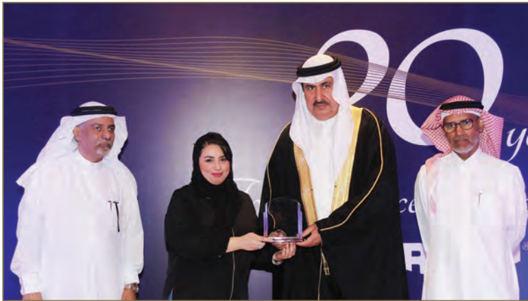
Afro Asian Assistant (AAA)