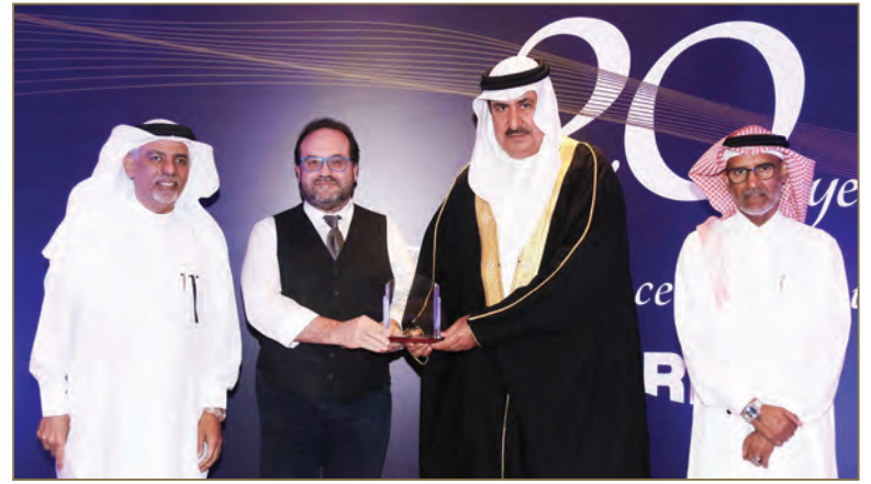
تكريم شركة زين للاتصالات - البحرين