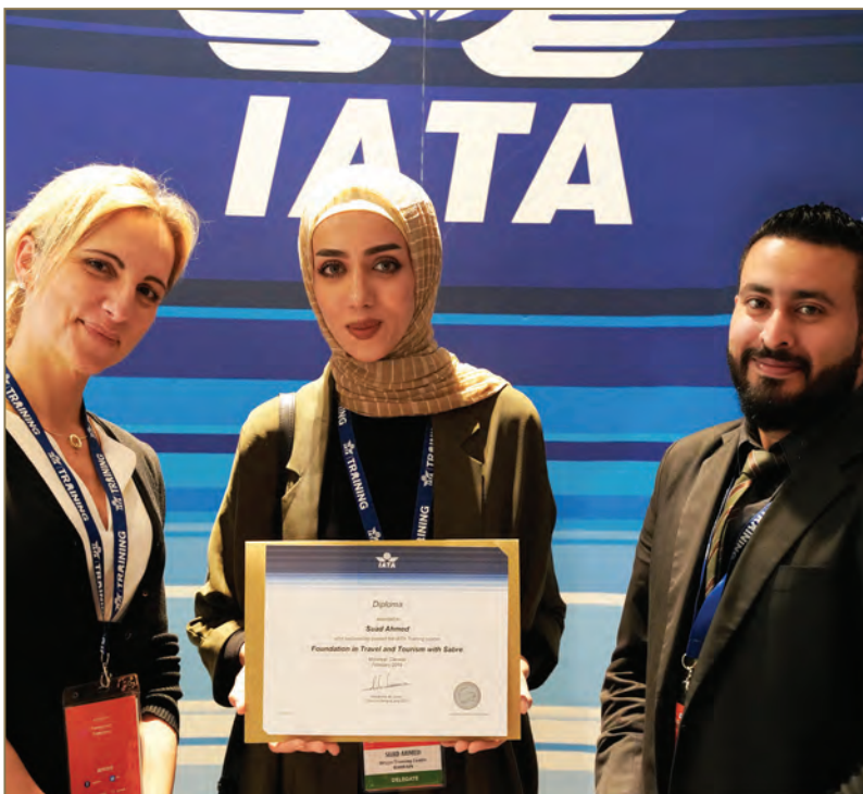
IATA acknowledges OTC for the graduates initiative to attend IATA Global Partners Conference

successfully advise the clients on the best travel options. Learn how to customize and construct complex travel itineraries, gain the skills to process ticket exchanges and reissues, and understand how industry regulations affect your travel operations. And recently OTC launched Managing the Travel Business Diploma which improves your management skills in accounting, negotiation, marketing, and product development with this flexible distance learning course from