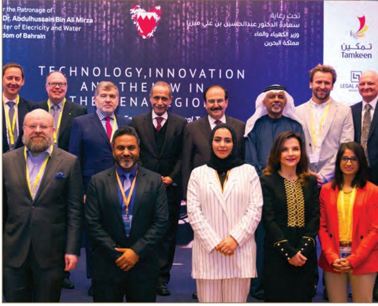
صورة جماعية مع سعادة الوزير وعدد من المتحدثين في المؤتمر خلال حفل الافتتاح

طريقة إجراء البحوث القانونية، حيث إنه في الآونة الأخيرة بدأت شركة ROSS Intelligence باستخدام جهاز كمبيوتر IBM يسمى «Watson» من أجل إجراء تلك البحوث القانونية، وتقوم شركات أخرى بتطوير تقنية مماثلة لتمكين المحامين من تفويض مهمة مراجعة العقود إلى جهاز الكمبيوتر، حتى أن بعض الشركات تحاول تطوير عقود ذكية يمكن أن تغير نفسها بناءً على مجموعة متنوعة من المعلومات. كما أصبحت المؤسسات القانونية تفضل توظيف الخبير القانوني الملم بالتقنيات الإلكترونية الحديثة على الخبير القانوني التقليدي، ومع ظهور تكنولوجيا الهواتف الذكية يمكن للناس الوصول إلى المعلومات القانونية المشتركة التي أصبحت سهلة وفي متناول أيديهم.