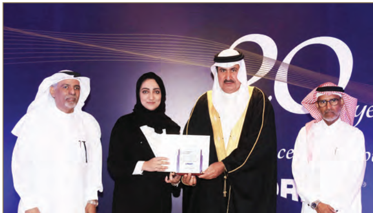
تكريم شركة اليوسف للصرافة