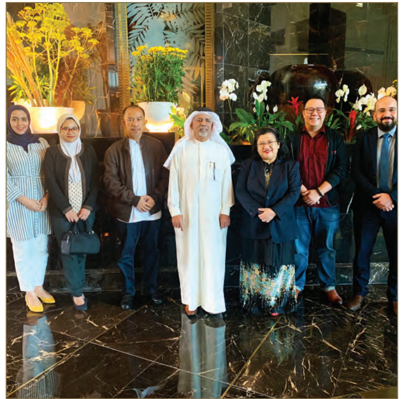
Origin Management with the delegation of Ministry of Entrepreneur Development - Malaysia