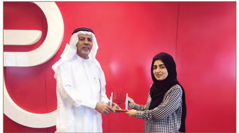
Bahrain Telecommunication Company (Batelco)