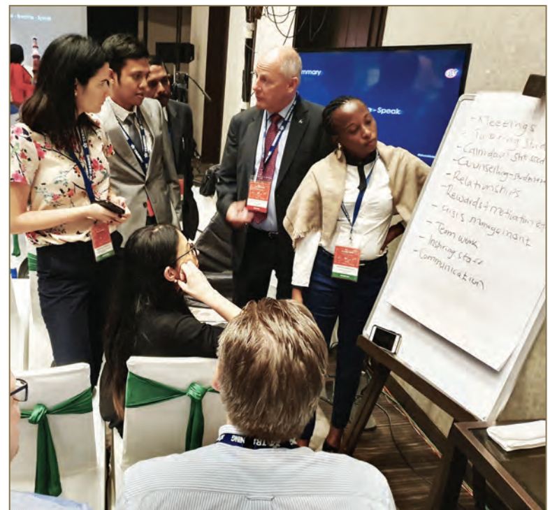
During the conference's session