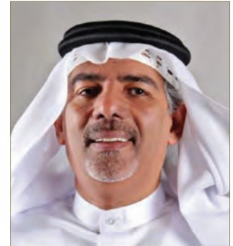
د. أحمد البناء الرئيس التنفيذي لمجموعة أوريجين

موظفيهم إما عن طريق إرسالهم للمشاركة في فعالياتنا السابقة أو من خلال تدريبهم في مركز أوريجين للتدريب في مختلف التخصصات ولنيل مختلف الشهادات المهنية المعتمدة دولياً.