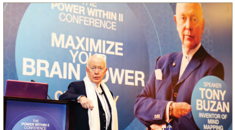
Origin event with Tony Buzan at the Ritz Carlton Hotel - Bahrain