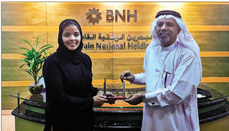
Bahrain National Holding (BNH)