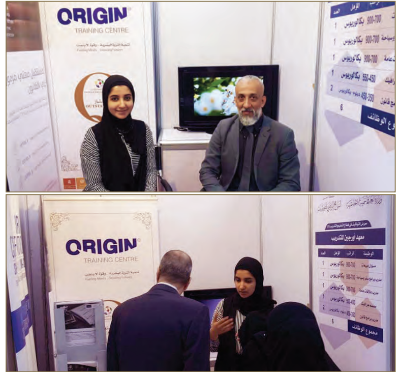
مقطعات من المعرض

ويعمل موظفو مركز أوريجين خلال هذا المعرض على دراسة احتياجات سوق العمل من خلال إحصاء تخصصات زوار المعرض وخصوصاً الوافدين لمنطقة عرض مركز أوريجين؛ وهو مايساهم في تطوير الخطة التدريبية من خلال التركيز على طرح برامج تدريبية تواتي عرض الباحثين