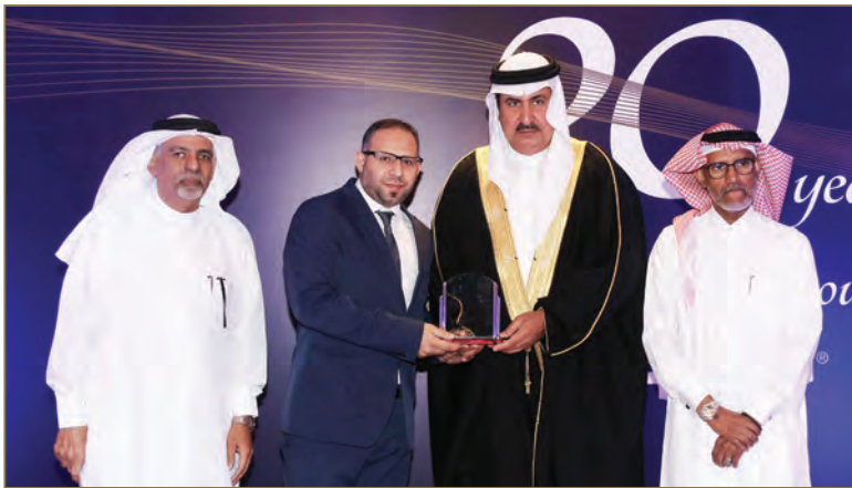
Sayed Mahdi Real Estate