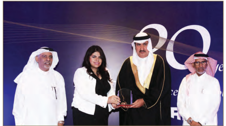
Gulf Aluminium Rolling Mill Company (Garmco)